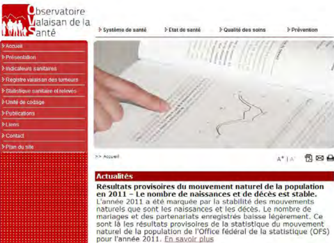
Abb. 1: Willkommenseite des WGO ( www.ovs.ch )

So hat das WGO Gesundheitsindikatoren entwickelt, die für alle Beteiligten im Gesundheitswesen und die Walliser Bevölkerung von Interesse sind und auf seiner Website zur Verfügung stehen www.ovs.ch . Auf der Willkommenseite der WGO-Website (Abbildung 1) findet sich die Rubrik „Gesundheitsindikatoren“, wobei die Indikatoren thematisch geordnet sind (Demographie, Krankenversicherung, Gesundheitskosten, Heilberufe, stationäre Versorgung, sozialmedizinische Versorgung, Gesundheitszustand der Bevölkerung). Die Daten zu diesen Indikatoren können herunter geladen werden.